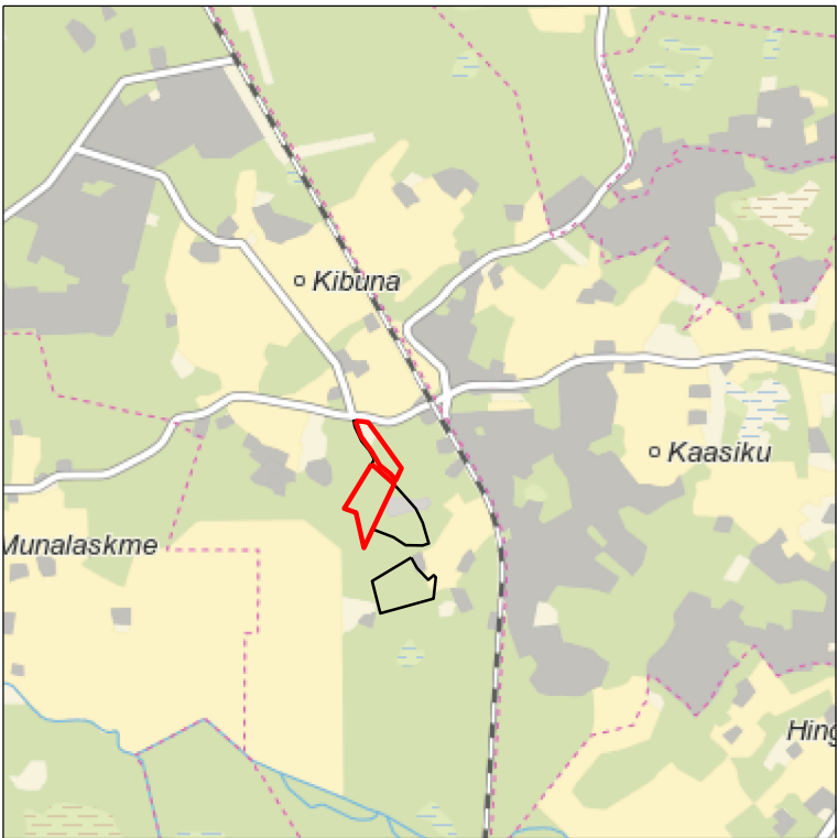
Kaardileht nr 6331 Keila